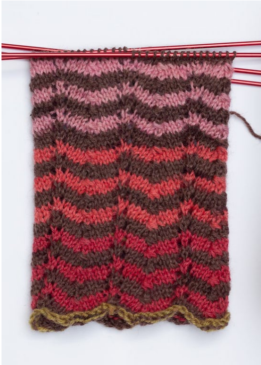
Mallikerta 12 s ja 2 krs