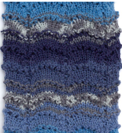
Mallikerta 14 silmukkaa ja 8 kerrosta