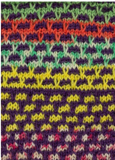
Mallikerta 4 s ja 8 krs