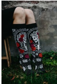
ROSITA Heini Perälä Koko: 38/39

Vaihtoehtoisia lankoja esim. Armonia , Aloe Sockwool , Sock 4 Armonia , Aloe Sockwool , Sock 4 Maija Maija