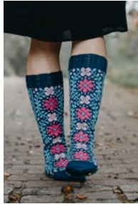
SEPPELE Heini Perälä Koko: 38/39